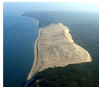
Dune du PYLA à 12kms