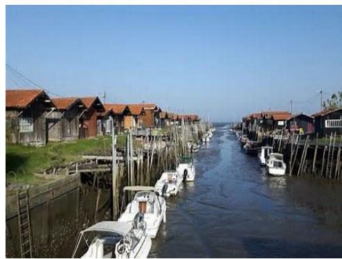
Port de Gujan-Mestras à 4 kms