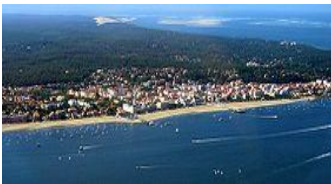
Arcachon à 11kms

1 pas de tir 9 positions, 22LR, couvert équipé de tables , accès par rampe 1 couloir de tir 22 LR, équipé de gongs ou de cibles, distances de 25 à 510m