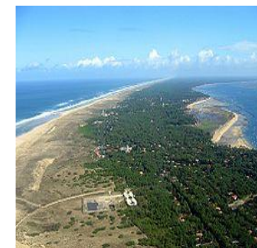
Cap Ferret à 50kms