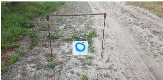
Cible 30 x 30