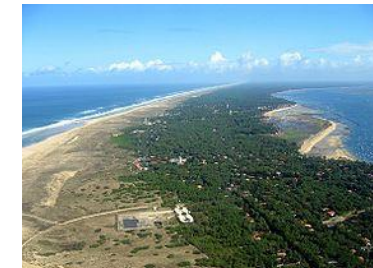
Cap Ferret à 50kms