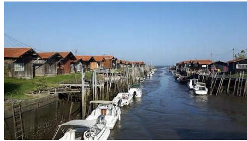
Port de Gujan-Mestras à 4 kms