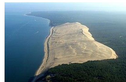
Dune du PYLA à 12kms