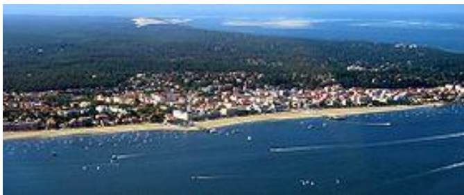
Arcachon à 11kms

1 pas de tir 9 positions, gros calibre (max 338), couvert équipé de tables , accès par escalier 1 couloir de tir gros calibre équipé de gongs ou de cibles, distances de 100 à 1600m